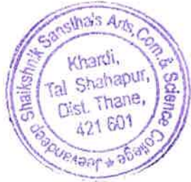
Head of Department