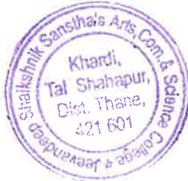
Head of Department